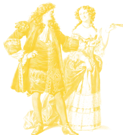
Illustration de la scène de la galère des Fourberies de Scapin de Molière.

Il s'agira d'énoncer un premier mensonge qui devra être mis en cause par l'interlocuteur. A chaque mise en cause, le menteur devra argumenter dans le sens de son mensonge pour finir par convaincre.